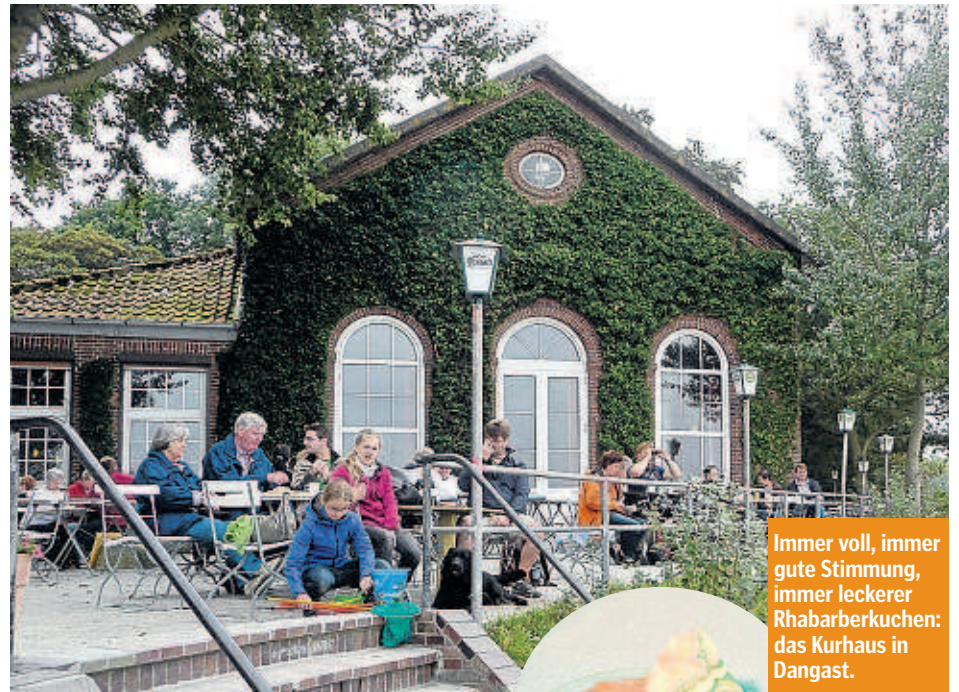
Immer voll, immer gute Stimmung, immer leckerer Rhabarberkuchen: das Kurhaus in Dangast.

Dangast am Jadebusen ist Künstlerkolonie, Badeort und legendärer Ausflugsort für alle Rhabarberkuchenfreunde